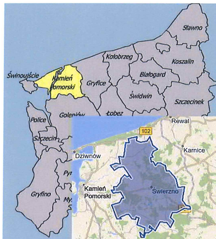
Rysunek 1. Położenie Gminy Świerzno